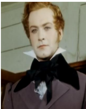
Онегин (фильм-опера «Евгений Онегин». 1958. Ленфильм)