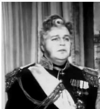
Муж Татьяны (Телеспектакль «Евгений Онегин». 1972. ЦТ Экран)