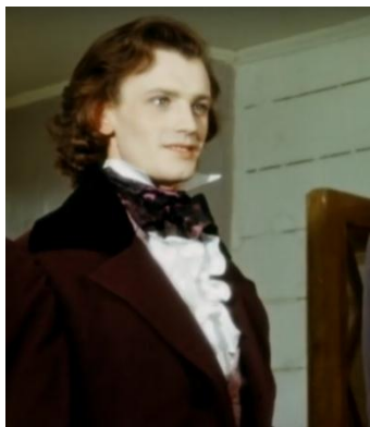
Ленский (фильм-опера «Евгений Онегин». 1958. Ленфильм)