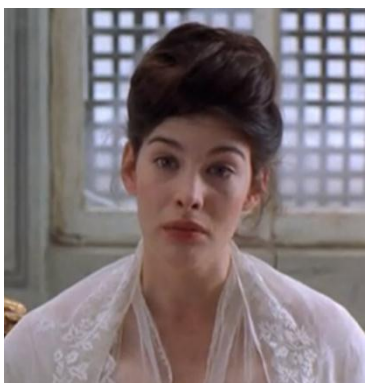
Татьяна ( «Онегин». 1999. Великобритания, США)

3. Прочитайте фрагмент воспоминаний о работе над экранизацией «Маленьких трагедий» А.С. Пушкина, выпуск картины был приурочен к 180-летнему юбилею Александра Сергеевича Пушкина и посвящен 150-летию «Болдинской осени».